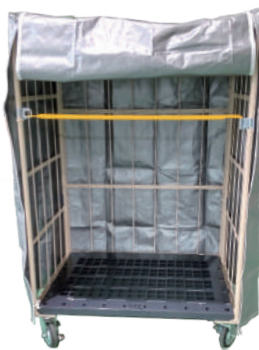
UV # 4000 シルバー