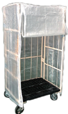
FT ナチュラルクロス